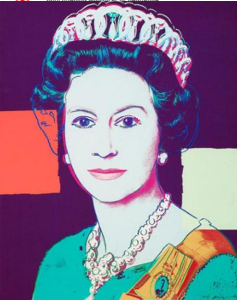
REINA ISABEL DE INGLATERRA ANDY WARHOL