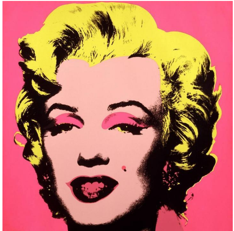
MARILYN MONROE ANDY WARHOL