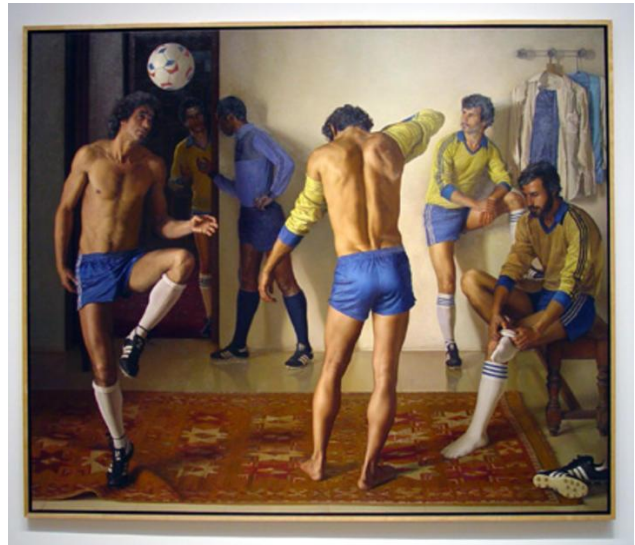
ANTES DEL JUEGO CLAUDIO BRAVO