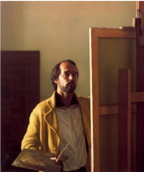
AUTORRETRATO CLAUDIO BRAVO