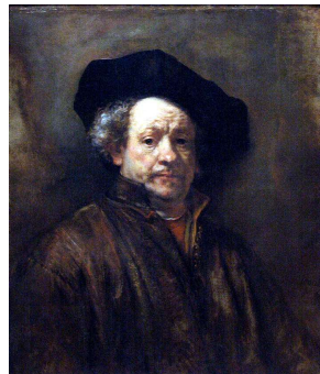
Autorretrato de Rembrandt