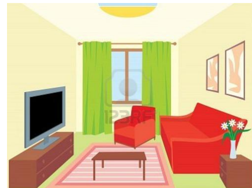
Living room= Living

Es importante saber cómo referirnos cuando hay una o más de una de estas partes de la casa. Por ejemplo cuando hay 1 Living, 3 Piezas, 2 Baños.