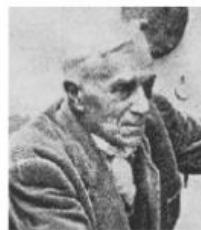
Georges Braque (1882-1963)