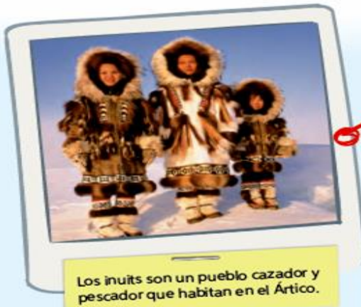
Los inuits son un pueblo cazador y pescador que habitan en el Ártico.

Algunos ejemplos de adaptación y transformación.