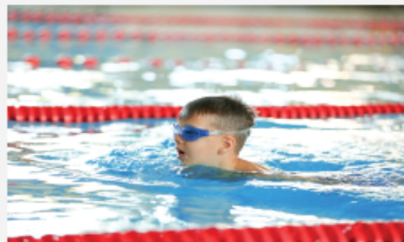
▲ Niño en clases de natación.