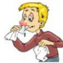
a runny nose