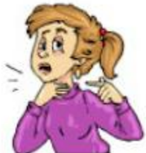
a sore throat