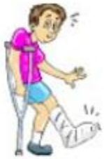
a broken leg

Aquí se expresan distintos problemas de salud que hemos visto durante estas semanas.