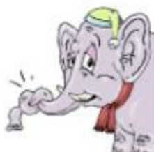
a stuffy nose