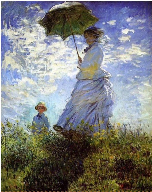
Claude Monet: Madame Monet con su