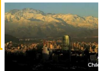
Recorriendo la Zona Central

https://www.youtube.com/watch?time_continue=2&v=3_CkinGwK5l&feature=emb_logo