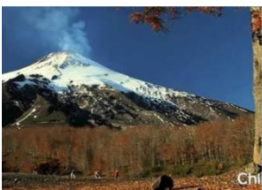
Recorriendo el sur de Chile

https://www.youtube.com/watch?time_continue=226&v=f1-iWZWHwGM&feature=emb_logo