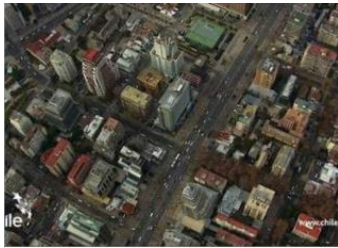
Chile y sus riquezas naturales

A CONTINUACION TE DEJO DISTINTOS ENLACES, PARA QUE PUEDAS VER LAS DISTINTAS ZONAS DE CHILE