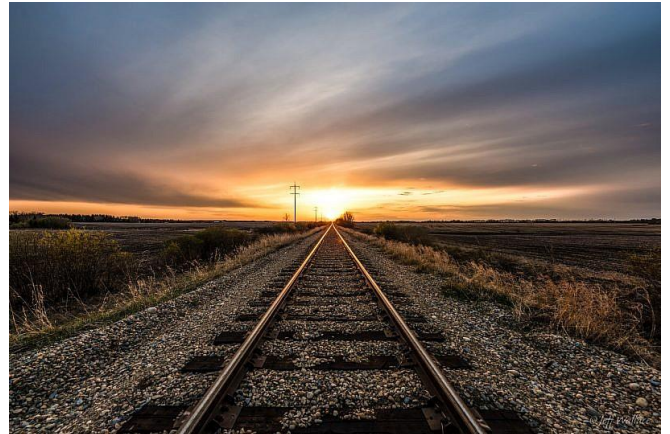
Punto de Fuga

La perspectiva es un sistema que permite representar tres dimensiones sobre una superficie plana, o sea, de dos dimensiones. La perspectiva lineal consiste en que las líneas paralelas que van de más cerca a más lejos, convergen en un punto de fuga , lo que crea una ilusión de profundidad.