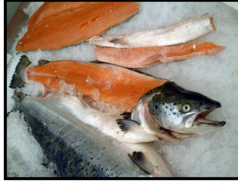
Salmón X región