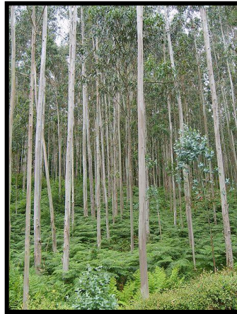
Bosque de Eucalyptus VII región.