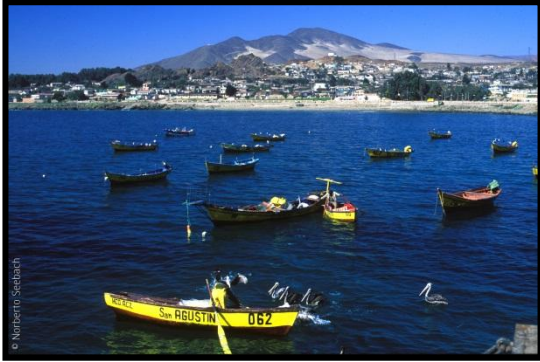
Anchoveta XV a la XIV región (sin RM)