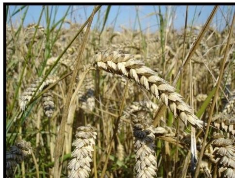
Trigo IX y XIV región