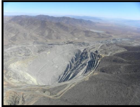
Mina hierro el Romeral III región