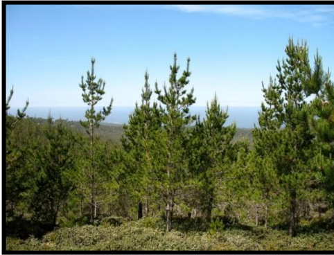
Bosque de Pinos VIII región.

Usa la columna de Actividades Económicas del cuadro comparativo que elaboraste en la clase 8 para relacionar cada recurso con su zona.