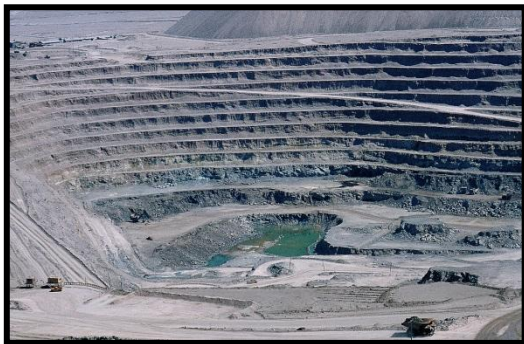
Mina cobre Chuquicamata II región