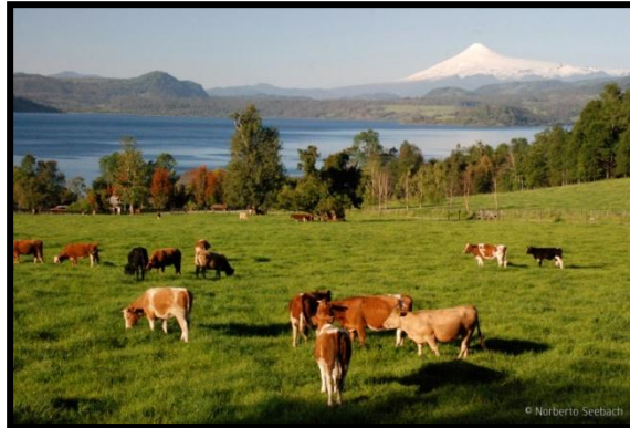
Vacas XIV y X región