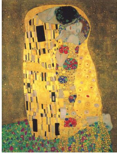
“El beso” Gustav Klimt