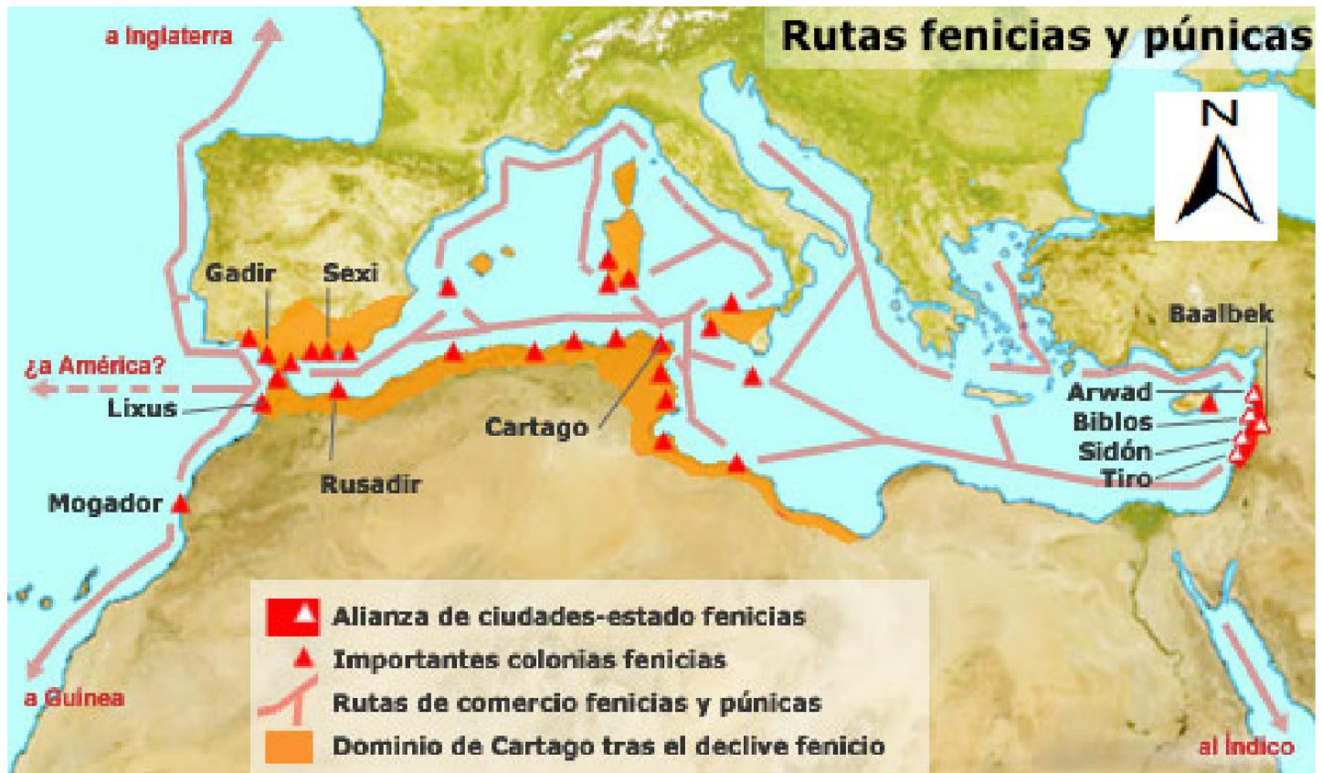
Mapa II: Rutas de comercio de los Fenicios y la Ciudad de Cartago.

El pueblo Fenicio controló las rutas de comercio en el mar mediterráneo, intercambiando productos entre los pueblos del oriente (continente asiático) y el occidente (Europa y norte de África), por ejemplo llevaba productos desde Persia, ubicada en medio oriente, productos hacia las polis griegas. Los fenicios tenían una ciudad muy poderosa llamada Cartago, que era el centro cultural y comercial del norte de África. Cartago, basó su riqueza gracias al control de comercio marítimo del mar mediterráneo. Ello derivó, en que controló zonas como el sur de España y la isla de Sicilia, donde tenían una importante producción de Trigo, que consumían principalmente en la ciudad de Roma. Por el control de dichos territorios, surgirán las guerras Púnicas, que pelearon las Ciudades de Roma y Cartago, venciendo Roma.