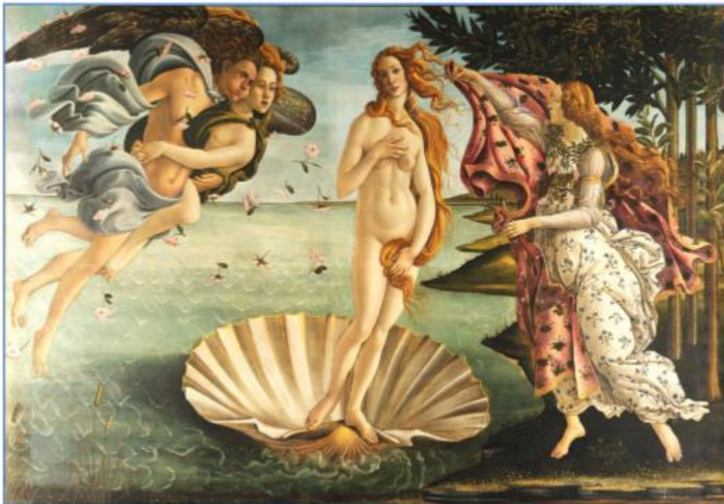
Pintura El nacimiento de Venus (Sandro Botticelli, circa 1484)

3. ¿Por qué crees tú, que al centro de esta pintura, el pintor dibuja a una mujer desnuda? ¿Qué intenta destacar?